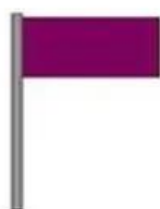
Baignade interdite (pollution /espèces spécifiques)