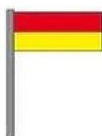
Baignade surveillée à certains horaires