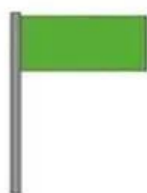
Baignade autorisée et surveillée