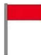
Baignade interdite et dangereuse