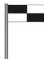
Zonne de pratiques aquatiques et nautiques