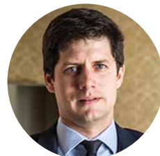
Julien Denormandie ministre auprès de la ministre de la Cohésion des territoires et des Relations avec les collectivités territoriales, chargé de la Ville et du Logement