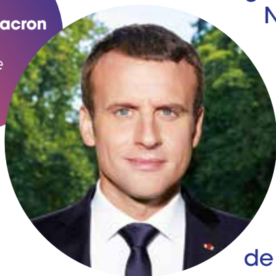
Emmanuel Macron président de la République

“L’éducation est le premier terrain de cette bataille pour la mobilité géographique et sociale (...).