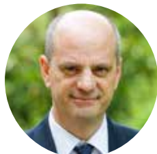
Jean-Michel Blanquer ministre de l'Éducation nationale et de la Jeunesse

80 territoires éligibles ont été sélectionnés après un travail fin avec les préfets et les recteurs. Nous proposons désormais aux collectivités, sans qu'il ne se fera, de s'engager dans cette démarche, au travers de l'élaboration d'une stratégie territoriale ambitieuse et partagée. L'État sera là pour les accompagner avec près de 100 millions d'euros engagés sur les trois prochaines années et l'engagement de toute la communauté éducative.